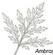
Ambrosia artemisiifolia Aufrechte Ambrosie

Anthemis tinctoria , Färber-Hundskamille; Tanacetum vulgare , Gemeiner Rainfarn