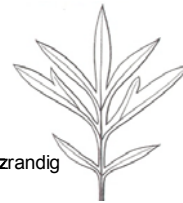
Artemisia verlotiflorum Verlot'scher Beifuss → Abschnitte ganzrandig

3' Blätter beidseitig weissfilzig behaart