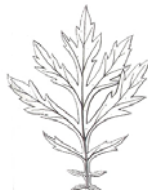
Artemisia vulgaris Gemeiner Beifuss → Abschnitte gezähnt

3 Blätter "zweifarbzig" → oberseits grün, unterseits weiss filzig